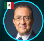
Jorge Fernando NEGRETE