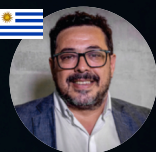
ALEJANDRO SÁNCHEZ Secretario de Presidencia de Uruguay